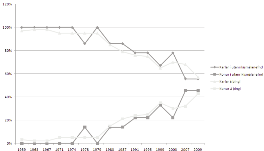
Mynd 1. Konur og karlar á Alþingi og í utanríkismálanefnd Alþingis 1959-2009. (Alþingistíðindi 1959-2009.)